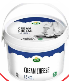
ARLA DJATHË SPALMABILE