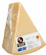
PARMIGIANO REGGIANO D.O.P. 18 MUAJ