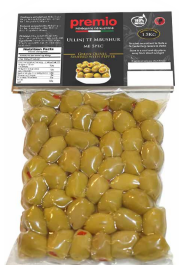
ULLINJ TË MBUSHUR ME SPEC Premio