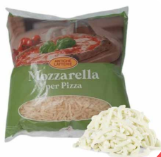
MOZARELA JULIEN ANTICHE LATTERIE