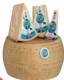
GRANA ITALIANE DA TAVOLA