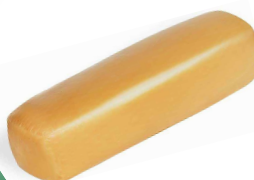
SKAMORZA DJATHË I TYMOSUR