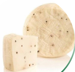
PEKORINO PRIMO SALE ME PIPER