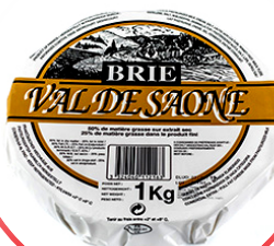
BRIE DJATHË FRANCEZ VAL DE SAONE