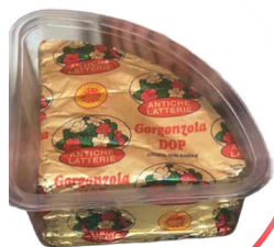
GORGONZOLA NOVARESE D.O.P