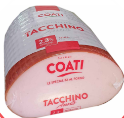
ROSTO GJOKS GJELI I PJEKUR