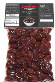
ULLINJ KALLAMON TË ZI Premio