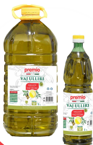
VAJ ULLIRI SALLATE Premio / Bidon & Shishe plastike