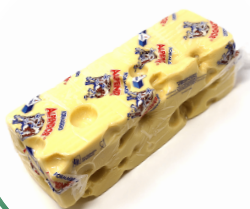
EMMENTAL DJATHË BAVAREZ