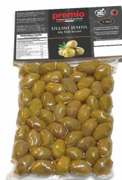
ULLINJ JESHIL ME BËRTHAMË Premio