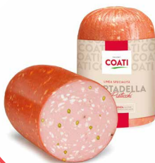
MORTADELA COATI 1/2 ME FISTIKE