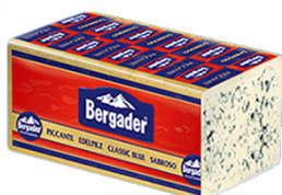
BERGADER EDELPILZ DJATHË PIKANT