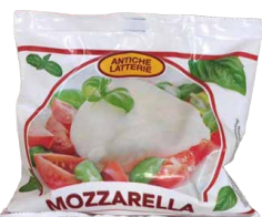
MOZARELA E FRESKËT BOKONCINO ITALIA