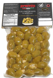
ULLINJ JESHIL PA BËRTHAMË Premio