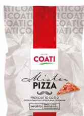
PROSHUTË E PJEKUR MISTER PIZZA