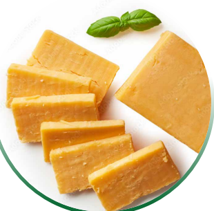
CHEDDAR DJATHË PORTOKALL