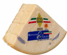
GRANA PADANO D.O.P