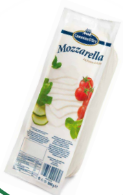
MOZARELA FILONE "CAMMINO D'ORO"