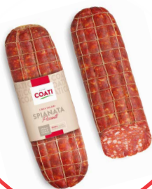
SALLAM SPIANATA KALABRA COATI 1/2