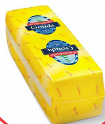
GOUDA DJATHË GJERMAN