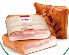
PANCETË STUFATA E PJEKUR, E TYMOSUR