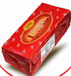
EDAMER 40% DJATHË GJERMAN