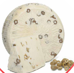
PEKORINO PRIMO SALE ME ULLINJ